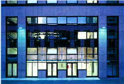
Fassadendetail am Neubau

Das Objekt verfügt über eine moderne Doppel-parkgarage, in der Stellplätze angemietet werden können. Sie ist direkt über die Aufzugsanlagen des Neubaubereiches erschlossen.