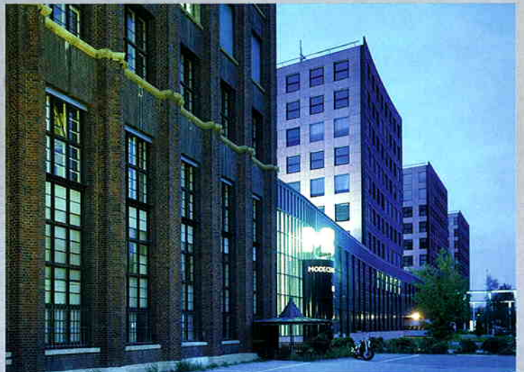
Illumination des historischen Gebäudes und der Erweiterungsbauten