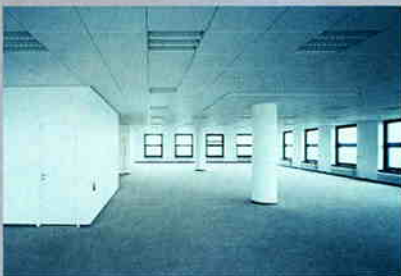
Großzügige Raumoptionen im Turm B